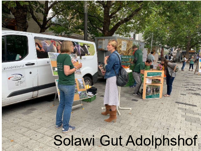
Solawi Gut Adolphshof